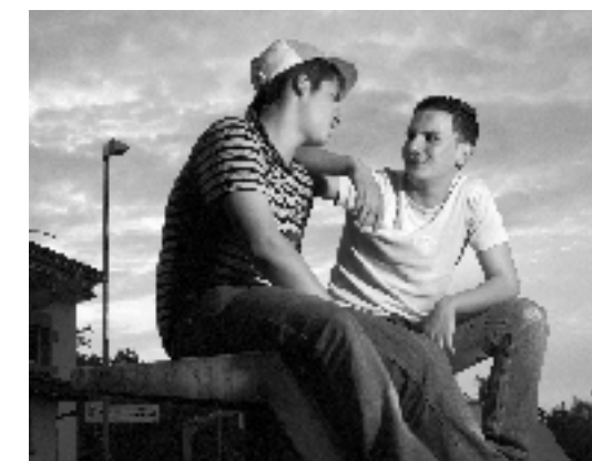
Persönliche Gespräche unter Freunden sind wichtig.