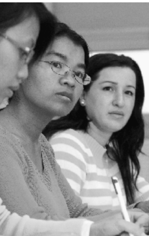
Aufmerksame Zuhörerinnen im Deutschkurs.

Die Gleichung "je besser die Sprachkenntnisse, desto höher der Integrationsgrad" geht nicht auf. Und schriftliche Sprachtests zur Messung der Integration sind noch aus weiteren Gründen völlig ungeeignet.