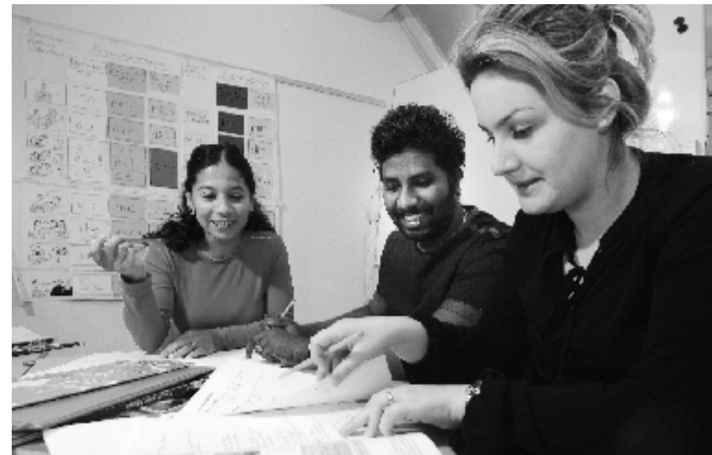
Ein Kurs bietet auch die Möglichkeit, Kontakte zu knüpfen und die Sprachkenntnisse in gelöster Atmosphäre auszuprobieren.

Deshalb empfiehlt die Eidgenössische Ausländerkommission (EKA) in ihren Empfehlungen an die Gemeinden, die Kantone und den Bund, bei der Einbürgerung auf schriftliche Sprachtests zu verzichten und dafür die kommunikativen Kompetenzen zu beurteilen. Denn ein Sprachtest prüft eher das Bildungsniveau als die Integration. Und der sozio-ökonomische Hintergrund der Gesuchstellenden bleibt unberücksichtigt. In unserer Gesellschaft weist eine zunehmende Zahl von Personen sehr bescheidene Lesekompetenzen auf. So haben gegen 10 Prozent der einheimischen Bevölkerung Mühe, der Packungsbeilage zu einem Medikament die vorgeschriebene Dosierung zu entnehmen. Der Anteil an Menschen mit geringen Lesekompetenzen in der Landessprache ist unter der eingewanderten fremdsprachigen Bevölkerung noch erheblich höher (über 60 Prozent). Mit einem schriftlichen Sprachtest besteht die Gefahr, diese grosse Gruppe von vornherein von einer Einbürgerung auszuschliessen.